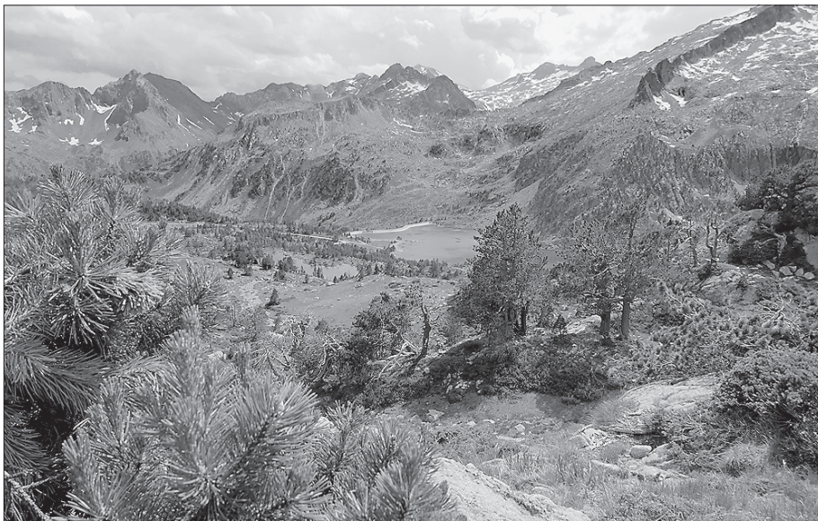
Fotovortrag am 18. November über den Pyrenäenweg GR10 in Frankreich.

Monatswanderung „Rund um Tiefensall“ am Sonntag, 17. Nov. 2019, Abfahrt: 13.00 Uhr Wertwiesenparkplatz in Künzelsau, Abmarsch: 13.30 Uhr in Tiefensall am Bolzplatz, Parkplätze an der Grillhütte, Wanderung: ca. 2,5 Stunden beziehungsweise 7 - 8 Kilometer. Abschluss ab circa 16.00 Uhr im Bürgerstüble „Zum Flad“ in Friedrichsruhe. Wanderführer sind Klaus und Barbara Megerle.