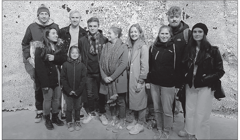
Studierende der Reinhold-Würth-Hochschule auf der Kunstbiennale.

Die Biennale Venedig ist nicht nur die älteste Kunstschau der Welt, sondern auch die renommierteste. Hier geht es um zeitgenössische Kunst, etwas auch um Politik, aber ganz sicher um viel Geld. Die Studierenden des Studiengangs BWL mit dem Schwerpunkt Kultur- und Freizeitmanagement konnten Ende Oktober 2019 im Rahmen einer Exkursion dieses von Ralph Rugoff kuratierte Großereignis der Kunst im wahren Sinne des Wortes hautnah erleben. Im Zentrum stand die Auseinandersetzung mit zeitgenössischen Positionen, das Kennenlernen der nationalen Beiträge, die ein sehr unterschiedliches Kulturverständnis und diverse Interpretationen des Biennale-Mottos „May you live in interesting times“ offenbarten, sowie eine genauere Untersuchung der wirtschaftlichen Seite des Kunstbetriebs. Den absoluten Höhepunkt bildete aber die Teilnahme der Studierenden an der Performance im litauischen Pavillon. Am letzten Aufführungstag konnten die Künzelsauer Studierenden als Statisten in dieser Strandszenerie mitwirken, sie spielten Ball, lasen in Büchern, cremten sich den Rücken ein – wie dies Touristen nun mal so tun – während um sie herum mal a cappella, mal im Chor Zeitkritisches zu Gehör ge-