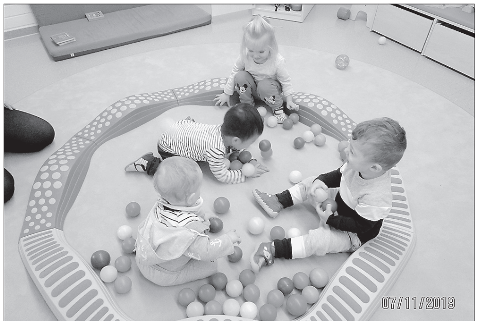
Die Kleinkinder erobern die neuen Räumlichkeiten der Krippengruppe.

Im Juli wurde mit den Umbauarbeiten begonnen und die Räumlichkeiten wurden zweckentsprechend eingerichtet. Ein Dank gilt allen Mitwirkenden, durch deren Engagement dieses Projekt in den wenigen Umbauwochen termingerecht umgesetzt werden konnte. Weiterhin