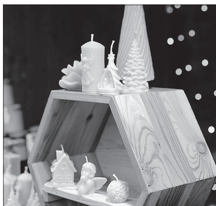
Kunsthändler bieten von Freitag bis Sonntag ihre Waren an.