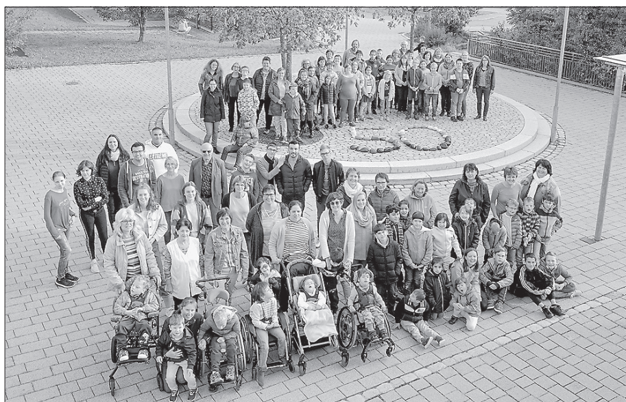
Die Schüler und das Kollegium der Geschwister-Scholl-Schule freuen sich über den runden Geburtstag ihrer Schule.

Die Geschichte der Geschwister-Scholl-Schule begann im September 1969. Damals richtete der Altkreis Künzelsau in Unterginsbach eine Klasse für Schüler mit geistiger Behinderung ein. Aus anfänglich sechs Schülern und einer Lehrkraft wurden im Laufe der Jahre über hundert Schüler mit mehr als vierzig Lehrern. Die Schule expandierte und drei kleinere Schulstandorte entstanden, welche 1984 am Schulort Künzelsau zusammengefasst wurden. Vier Jah-