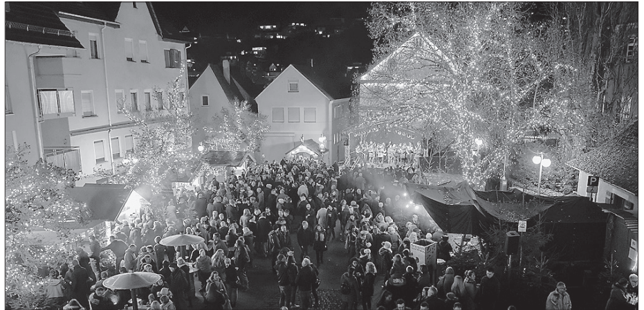
Der Schlossplatz bietet für den Advent am Schloss ein herrlich stimmungsvolles Ambiente.

Winterweihnachtlich bleibt es in der Künzelsauer Innenstadt auch nach dem