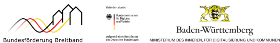
Abbildung 1: Unterstützt durch Fördermittel des Bundes und des Landes

An dieser Stelle bedankt sich die Stadt beim Bundesministerium für Verkehr und digitale Infrastruktur sowie beim Ministerium für Inneres, Digitalisierung und Migration des Landes Baden-Württemberg für die großzügige finanzielle Unterstützung des kommunalen Breitbandausbaus.