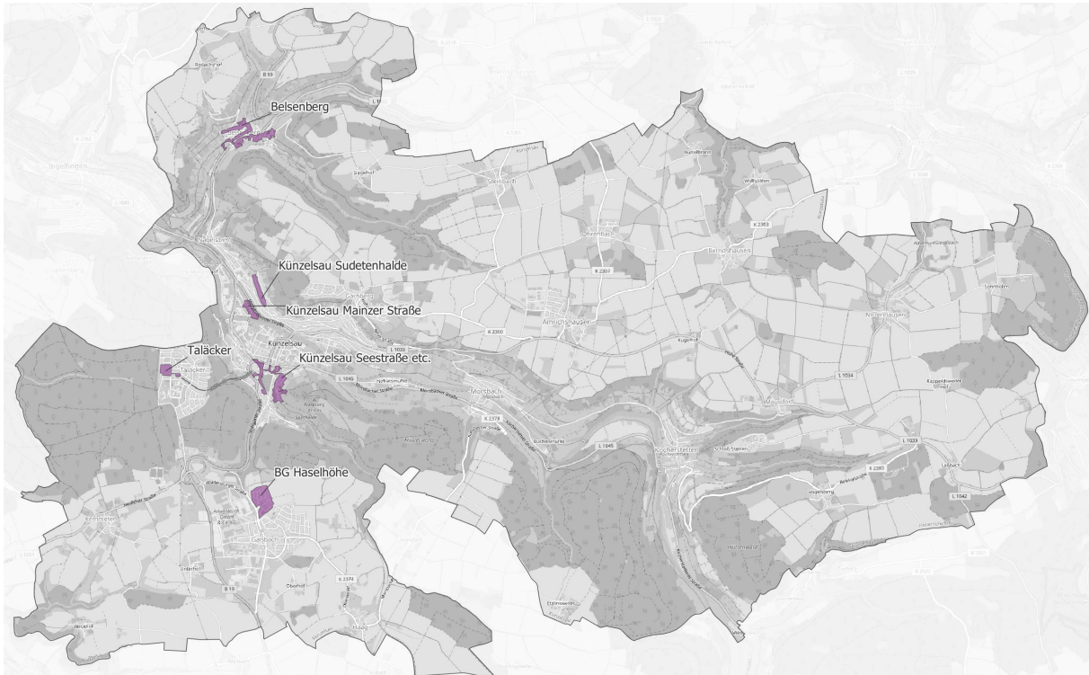
Abbildung 5: Eigenausbaugesamte der Stadt Künzelsau

Ausbaugesamte: Belsenberg größtenteils, Sudetenhalde komplett, Künzelsau Innenstadt teilweise, Mainzer Straße teilweise, Taläcker teilweise, Gaisbach teilweise, Haselhöhe „BG I“ komplett