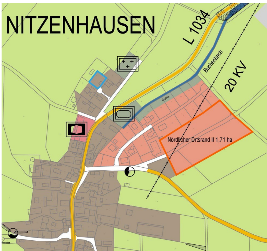
Abb. 2: Auszug aus der 7. Änderung des Flächennutzungsplans, Auszug Planflächen in Künzelsau-Nitzenhausen, ohne Maßstab