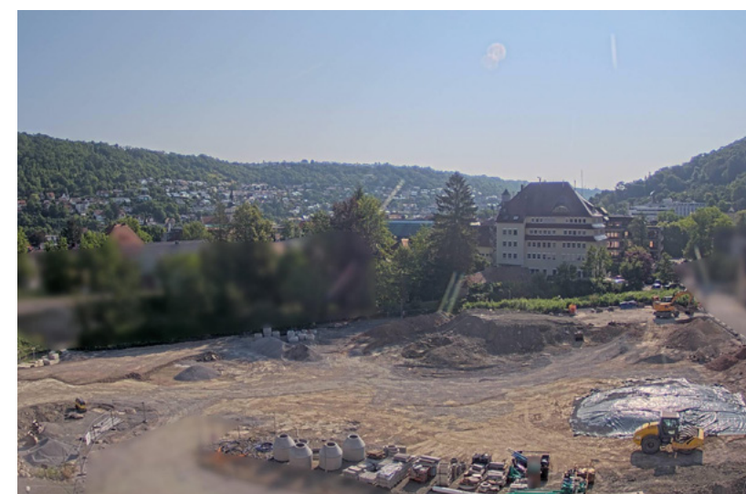
Blick auf die Baustelle „Stadteingang“, alle 15 Minuten ein neues Bild.

Wettbewerbsergebnis bietet Gaisbach hervorragende Möglichkeiten zur Weiterentwicklung