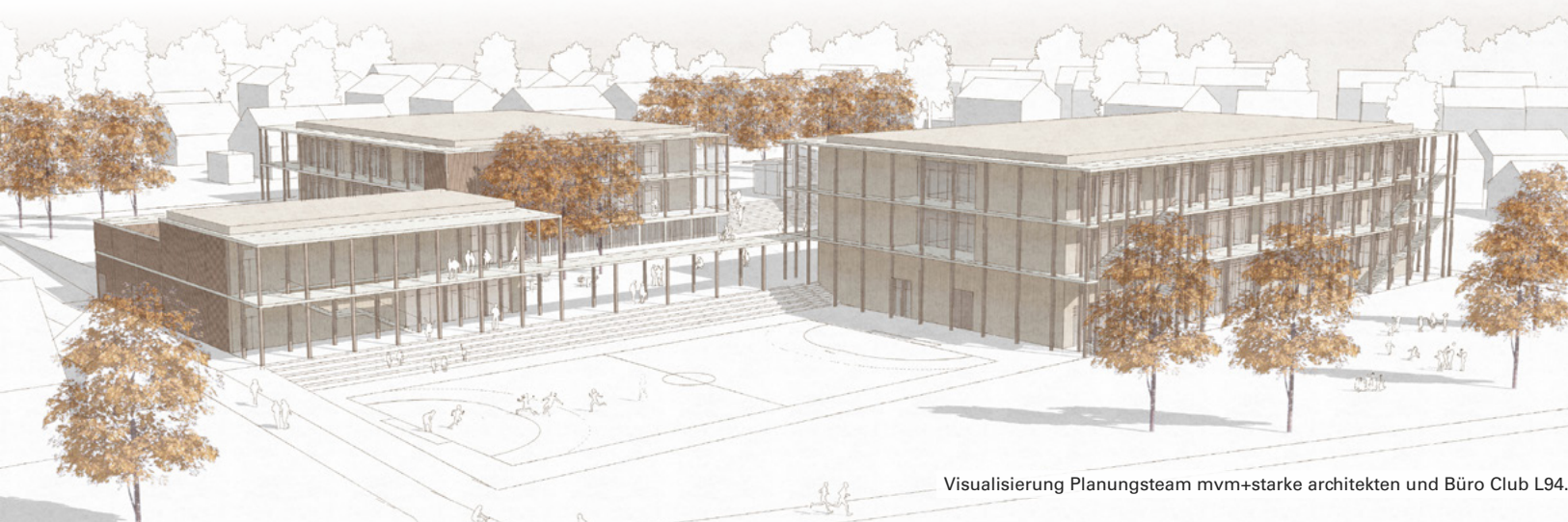
Visualisierung Planungsteam mvm+starke architekten und Büro Club L94.

werden vom 29. Juli bis einschließlich 4. August 2024 in der Mehrzweckhalle Gaisbach ausgestellt. Öffnungszeiten sind Montag bis Sonntag von 13 bis 19 Uhr.