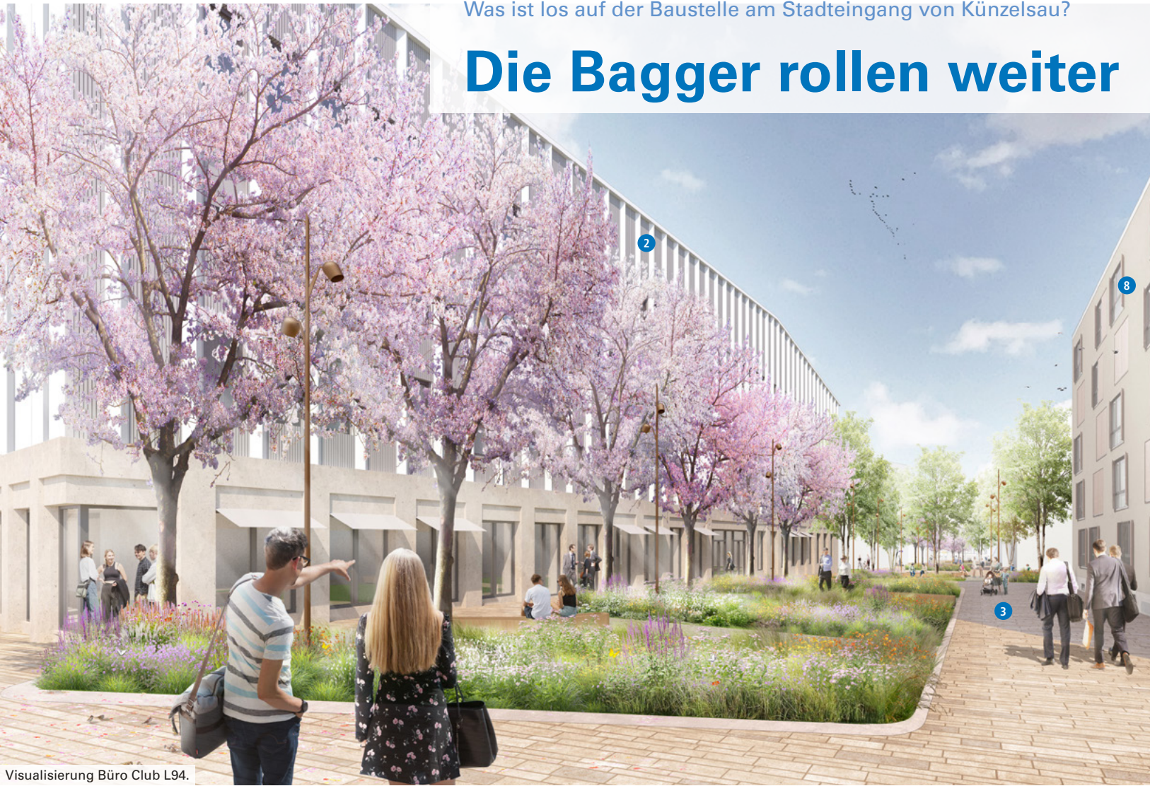
Visualisierung Büro Club L94.

In der Künzelsauer Innenstadt im Sanierungsgebiet Stadteingang Stuttgarter Straße ist ganz schön was los. Das Areal wird für den Bau des städtischen Parkhauses ELSA und den Bau des Kreishauses vorbereitet.