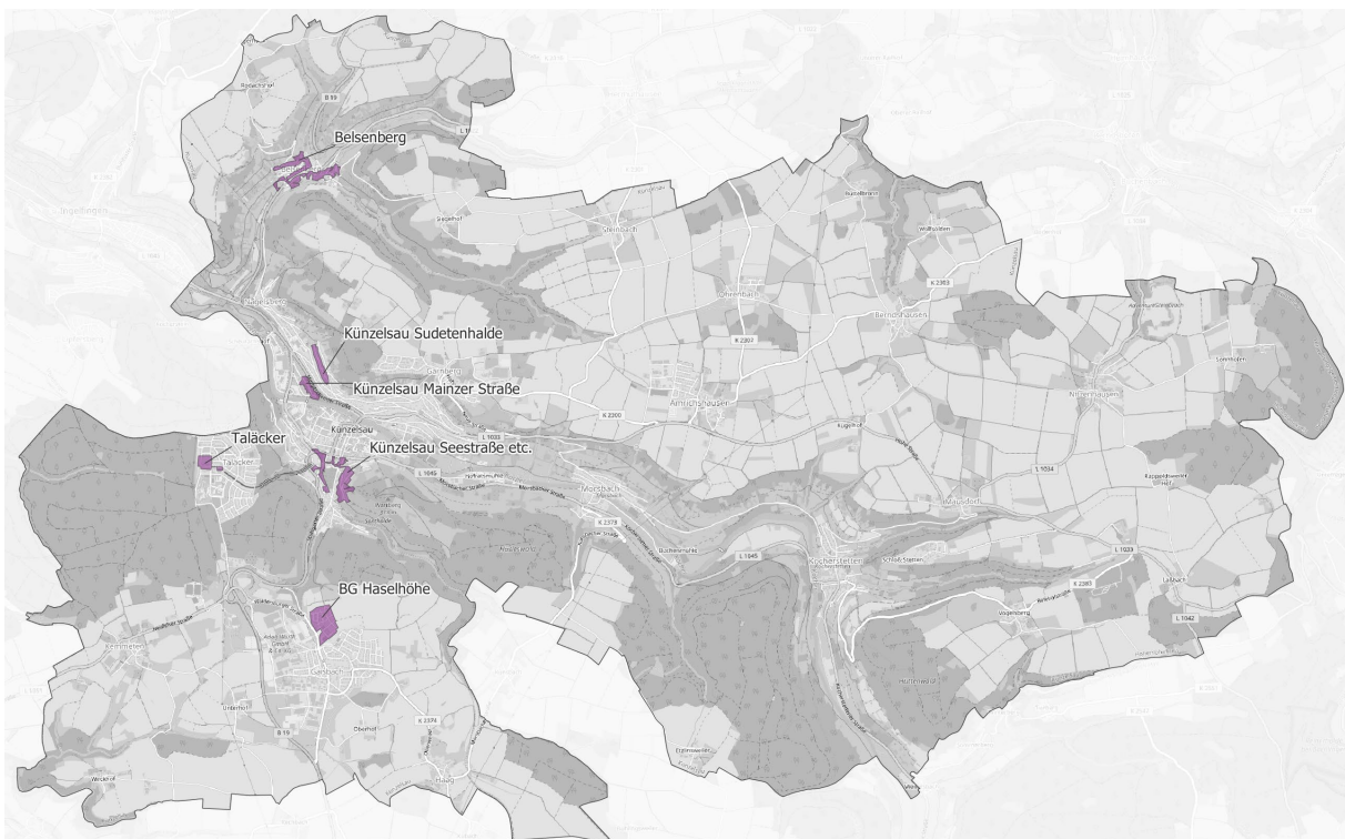
Abbildung 5: Eigenausbaugesamte der Stadt Künzelsau

Ausbaugesamte: Belsenberg größtenteils, Rösleinsberg, Am Künsbach, Oberer Sonthaldenweg, Sudetenhalde komplett, Künzelsau Innenstadt teilweise, Mainzer Straße teilweise, Taläcker teilweise, Gaisbach teilweise, Haselhöhe „BG I“ komplett und Neuerschließung Schloss Stetten.