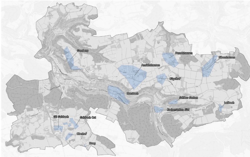
Abbildung 4: Ausbaubereiche im FöA „Graue Flecken“ AktZ.: 832.6/10-22 01BW20831

Das derzeit größte Förderprojekt der Stadt Künzelsau umfasst mehrere Ortsteile, die großteils wie auch zuvor im Zuge von Erneuerungen von Strom- bzw. Wasserleitungen mit Breitbandinfrastruktur ausgebaut werden sollen.