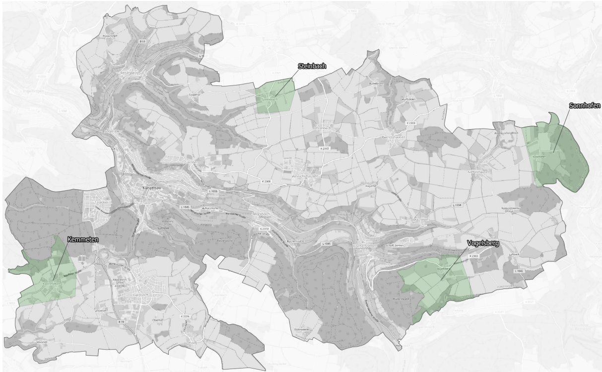
Abbildung 6: Bestandsnetz der Stadt Künzelsau

Ausbaugebiete: Steinbach, Sonnhofen, Vogelsberg, Kemmeten