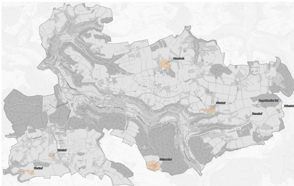
Abbildung 3: Ausbaubereiche im FöA „Weiße Flecken“ AktZ.: 832.5/3-21 09BW200798

Fördergebiete: Ohrenbach, Rappoldswweiler Hof, Falkenhof, Bienenhof, Mäusdorf, Etzlinsweiler, Unterhof und Weckhof