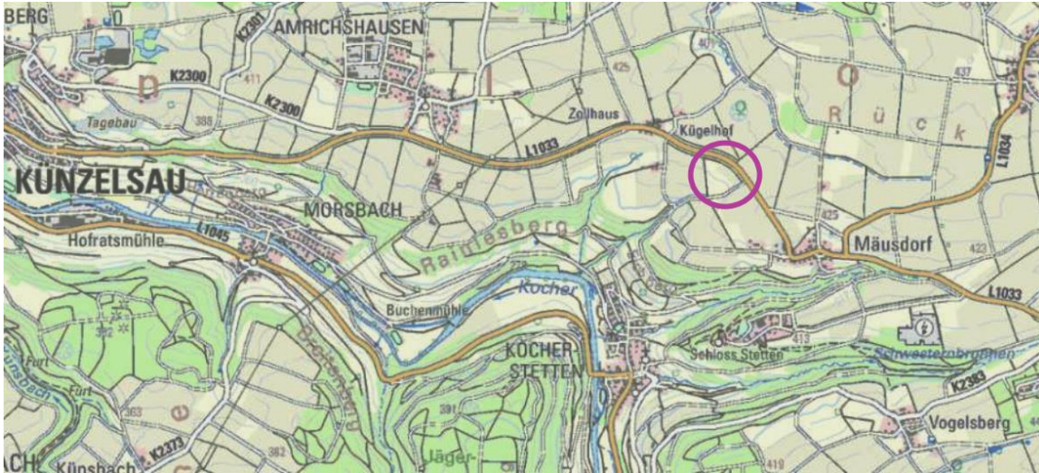
Lage der Vorhabensfläche - Übersichtskarte