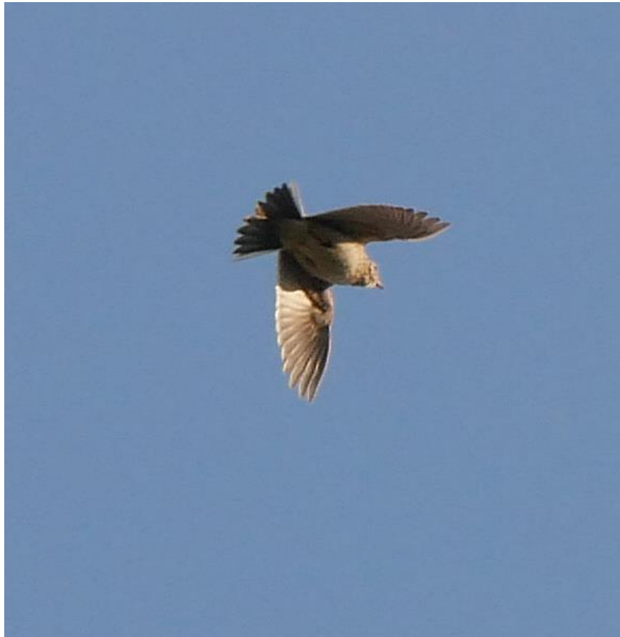
Feldlerche über der Vorhabensfläche

Auftraggeber: Jochen Schurg Eichholzweg 20 74653 Künzelsau