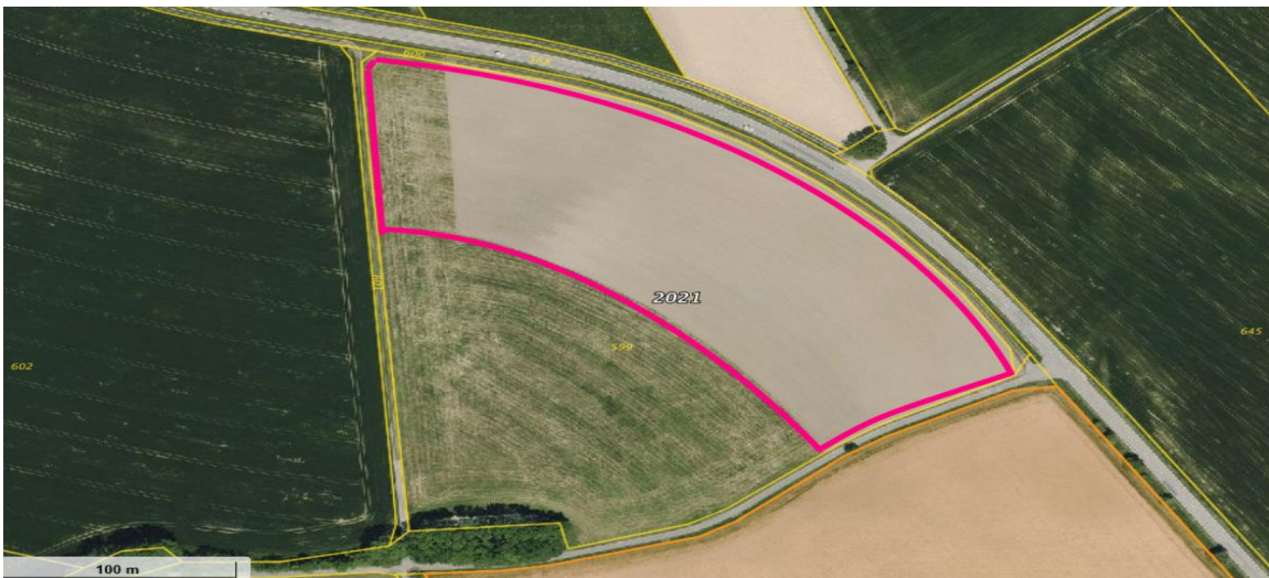
Lage der Vorhabensfläche - Orthofoto

Das Vorhabensgebiet liegt auf freiem Feld ca. 500 m nordwestlich des Ortsrandes von KÜN-Mäusdorf. Nördlich davon grenzt die L 1033 mit einem straßenbegleitenden, leicht befestigten Fahrweg an. An der Südostseite verläuft ein asphaltierter Wirtschaftsweg, auf der Westseite ein Grasweg. Südöstlich grenzt intensiv genutztes Wirtschaftsgrünland an.