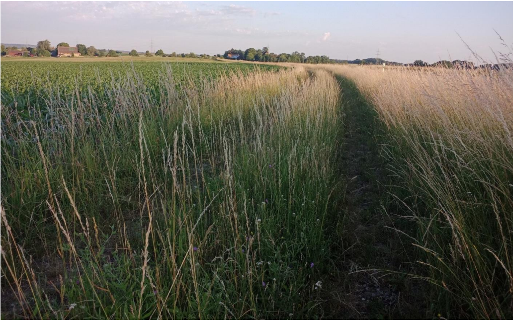
Nordrand der Vorhabensfläche (16.6.22)