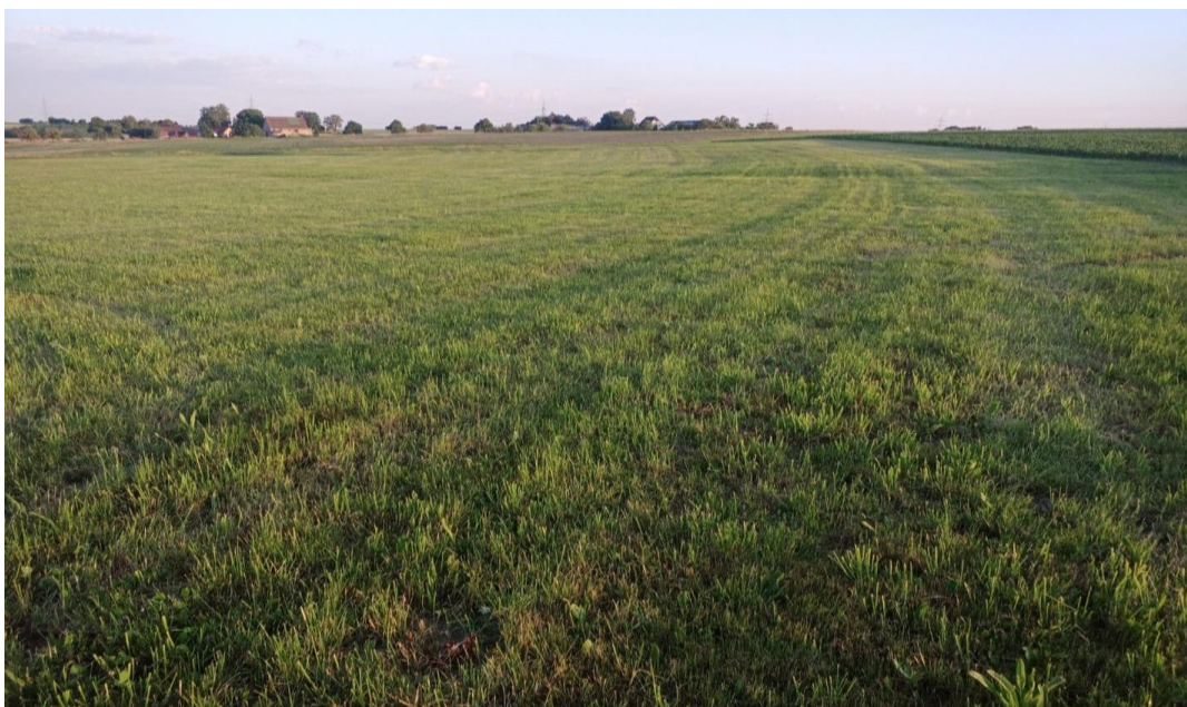
Westrand der Vorhabensfläche (16.6.22)