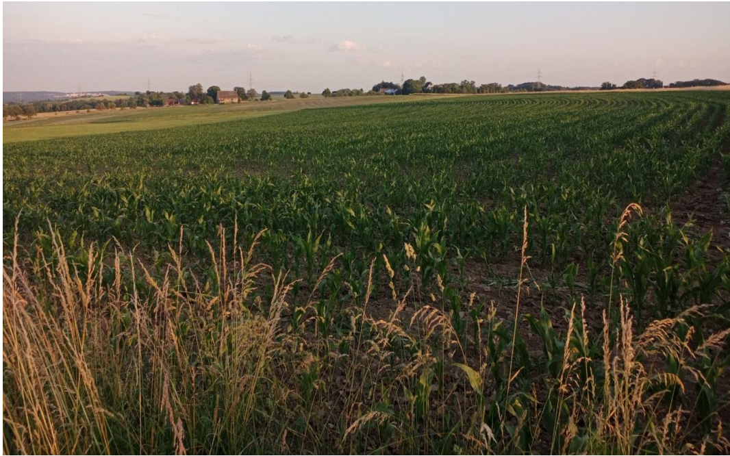
Blick von Süden auf die Vorhabensfläche (16.6.22)