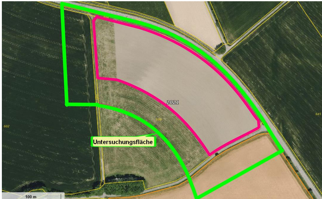
Orthofoto mit Umfang der Untersuchungsfläche

Als Untersuchungsgebiet wurde die Vorhabensfläche zuzüglich eines umgebenden 40 m breiten Streifens festgelegt (siehe den Luftbildausschnitt unten), weil durch die Kulissenwirkung der geplanten Fotovoltaikanlage auch die Biotopqualität der Umgebung gemindert werden kann – so z. B. hinsichtlich der Brutstandorte für die Feldlerche. Nur im Bereich der angrenzenden Straße wurde auf diese Erweiterung verzichtet, weil hier die Störungen durch den Verkehr jene der Fotovoltaikanlage marginalisieren.