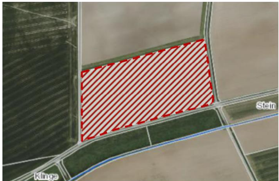
Lageplan der Planfläche (rot umrandet,. Quelle: Kartendienst der LUBW

Das Plangebiet umfasst landwirtschaftlich genutzte Flächen in der Feldflur südlich von Steinbach. Auch die an das Plangebiet anschließenden Flächen werden als Acker genutzt. Südlich des Plangebiets in einem Abstand von etwa 50m verläuft der Ohrenbach mit Gewässerbegleitgehölzen.