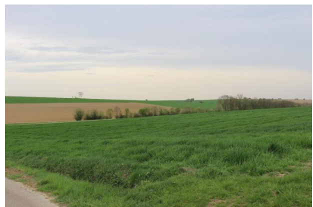
Planungsgebiet (nordöstliche Grenze)