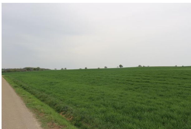
Planungsgebiet (südliche Grenze)